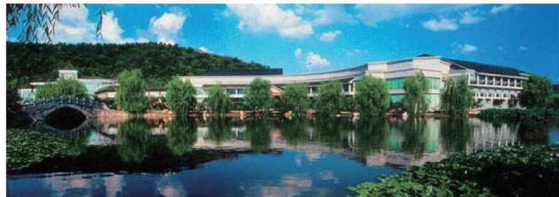
杭州太虚湖假日酒店